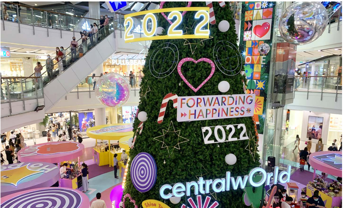
買い物客で賑わうバンコクのショッピングモール内 (2021年12月某日)

タイ国家経済社会開発委員会 (NESDC) は昨年11月15日、2021年の実質GDP成長率の見通しについて1.2%、2022年を3.5~4.5%と予測しました。新型コロナワクチン接種率の上昇などによる国内需要の回復、好調な輸出、政府の積極的な財政出動などによりプラス成長を予測しています。